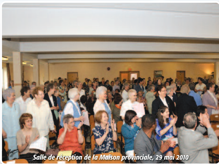
Salle de réception de la Maison provinciale, 29 mai 2010

L'année 2010 a été vécue sous le signe de l'action de grâce. En effet, le 150 e anniversaire de fondation de la Congrégation a été célébré dans la Province de multiples façons. Avec le peuple de Dieu: en paroisse, dans nos deux écoles privées, avec les voisins et voisines, les partenaires, les personnes engagées dans l'affiliation et dans le laïcat consacré SSCM, avec les jeunes adultes en cheminement, et, enfin, avec les personnes qui sont en lien avec les sœurs dans les différents milieux où nous sommes insérées. Partout l'accueil fut chaleureux et porteur de reconnaissance. Le grand rassemblement de la Province a été vécu le 29 mai 2010. Il y avait de l'esprit de famille dans l'air. Temps de festivité, de visibilité, de fierté qui, nous l'espérons, par l'action de l'Esprit, continuera de produire du fruit.