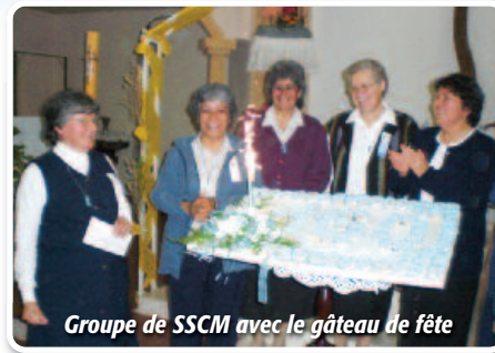
Groupe de SSCM avec le gâteau de fête

À Presidencia de La Plaza, notre célébration du 150 e anniversaire de la Congrégation s'est vécue le 13 juin 2010, lors de la fête du Saint Cœur de Marie. Un DVD de la Congrégation a été présentée au début de la messe; les gens en ont été