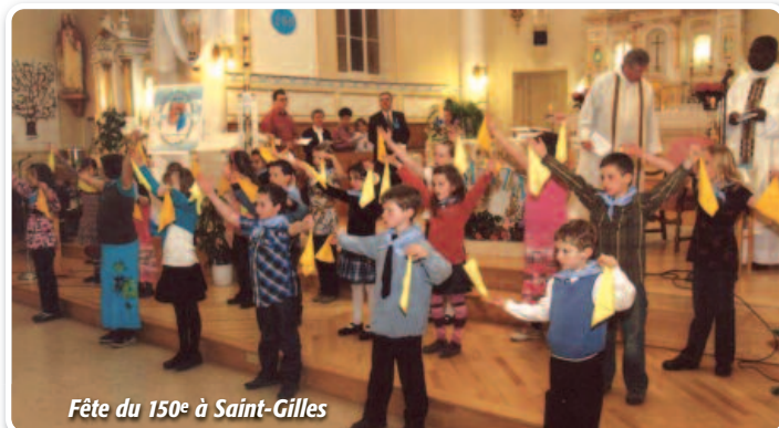
Fête du 150 e à Saint-Gilles