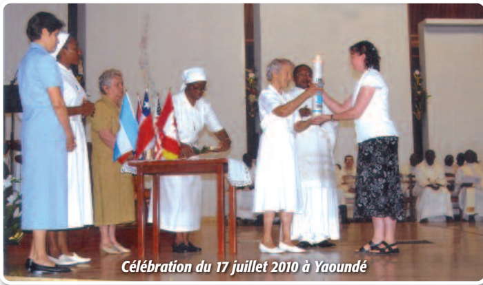
Célébration du 17 juillet 2010 à Yaoundé