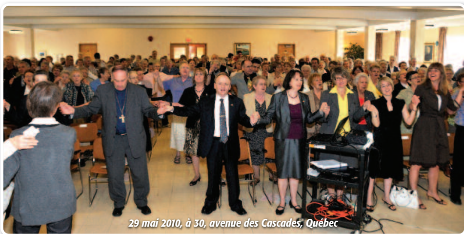
29 mai 2010, à 30, avenue des Cascades, Québec

Victor TONYE BAKOT , archevêque métropolitain de Yaoundé District Marie-Reine-des-Apôtres, Cameroun