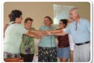
Groupe de personnes affiliées