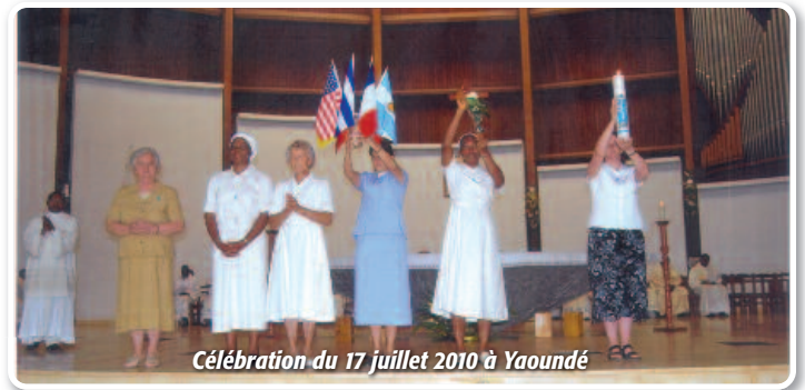
Célébration du 17 juillet 2010 à Yaoundé