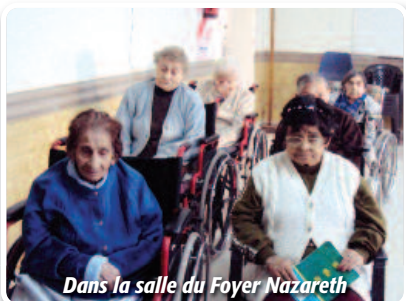
Dans la salle du Foyer Nazareth

Nous ne voulons pas oublier les personnes âgées du «Foyer Nazareth» qui nous ont accompagnés en cette année jubilaire par leurs prières constantes pour la Congrégation et pour les sœurs qui ont œuvré à cet endroit.