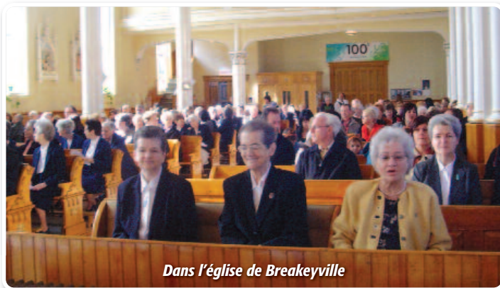
Dans l'église de Breakeyville