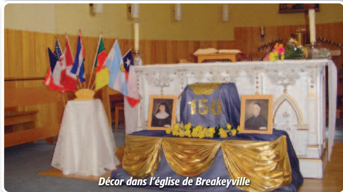
Décor dans l'église de Breakeyville