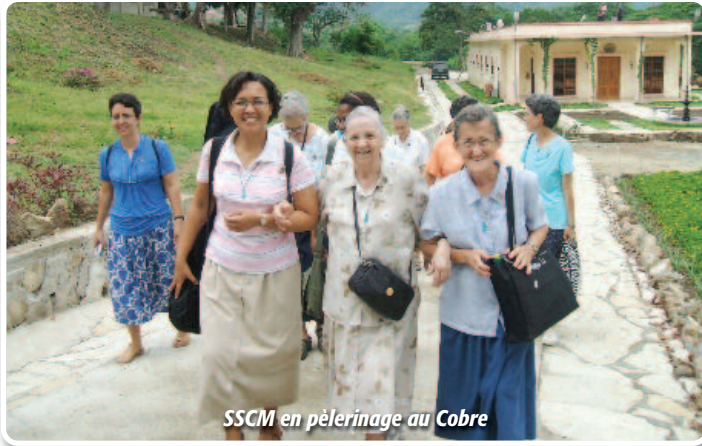
SSCM en pèlerinage au Cobre