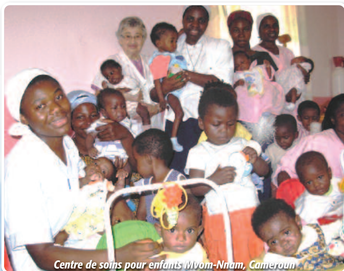
Centre de soins pour enfants Mvom-Nnam, Cameroun