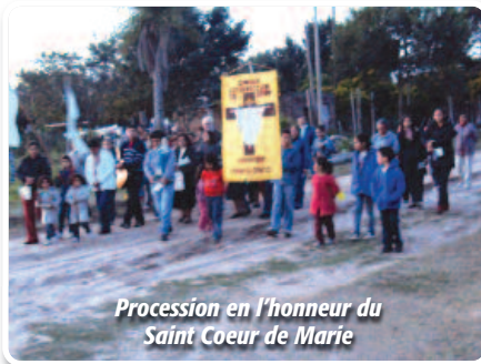
Procession en l'honneur du Saint Cœur de Marie