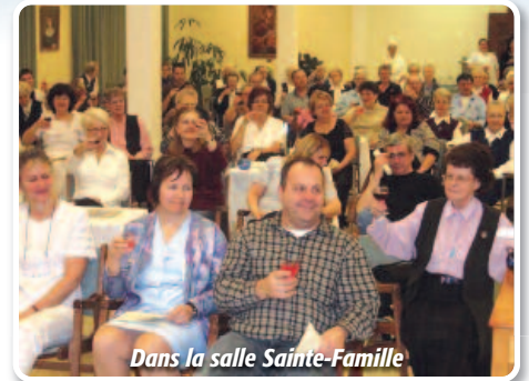
Dans la salle Sainte-Famille