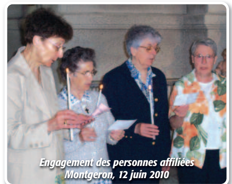
Engagement des personnes affiliées Montgeron, 12 juin 2010

Bien loin d'être célèbres parmi toutes les nations, humblement, nous avons traversé les siècles au gré des événements sociaux, politiques et religieux. L'Esprit nous a poussées à développer l'Évangile auprès des jeunes et des familles. Des hommes et des femmes ont trouvé chez les Servantes du