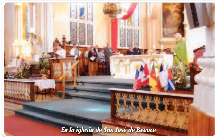
En la iglesia de San José de Beauce

El año 2010 ha sido vivido bajo el signo de la acción de gracias. En efecto, el 150° aniversario de fundación de la Congregación ha sido celebrado en la Provincia de múltiples maneras. Con el pueblo de Dios: en parroquia, en nuestras dos escuelas privadas, con los vecinos, los colaboradores, los afiliados y los laicos consagrados SSCM, con los jóvenes adultos en formación, y, en fin, con las personas que tienen vínculos con las hermanas en los diferentes medios donde estamos presentes. En todas partes la acogida fue calurosa y portadora de agradecimiento. El gran encuentro de la Provincia fue vivido el 29 de mayo de 2010. El espíritu de familia estaba en el aire. Tiempo de fiesta, de visibilidad, de orgullo que, así lo esperamos, continuará dando fruto por la acción del Espíritu.