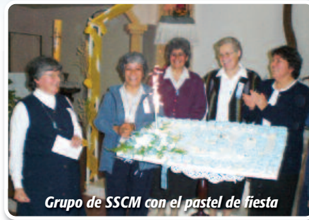
Grupo de SSCM con el pastel de fiesta

En Presidencia de la Plaza, nuestra fiesta de los 150° aniversario de Congregación se vivió el día 13 de junio de 2010, fiesta del Corazón de María. Al comienzo de la misa se presentó el video de la Congregación y lo impactante fue cuando