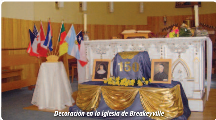
Decoración en la iglesia de Breakeyville