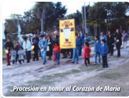
Procesión en honor al Corazón de María