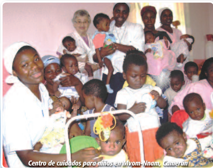
Centro de cuidados para niños en Mvom-Nnam, Camerún