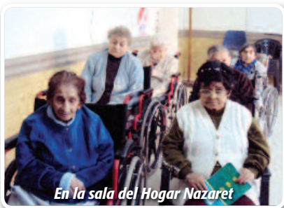
En la sala del Hogar Nazaret

No queremos olvidar a nuestros abuelos y abuelas del Hogar de Ancianos "Nazaret", quienes nos acompañaron en este año jubilar con sus constantes oraciones por la Congregación y por las Hermanas que han trabajado en este lugar.