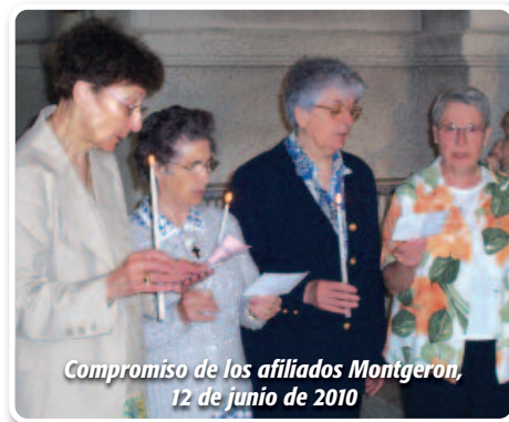
Compromiso de los afiliados Montgeron, 12 de junio de 2010

Lejos de ser célebres entre todas las naciones, hemos atravesado los siglos humildemente, a merced de acontecimientos sociales, políticos y religiosos. El Espíritu nos ha impulsado a dar a conocer el Evangelio entre los jóvenes y las familias. Hombres y mujeres han encontrado en las Siervas del Corazón de María la manera de desarrollar su vida cristiana a la luz del Evangelio. En la celebración Eucarística que reunía, el 12 de junio de 2010 en Montgeron, comunidades, amigos, familias, los afiliados renovaron su deseo de vivir según el espíritu de los Fundadores. Festejar a María en el Corazón que reza, que escucha, que se ofrece y que engendra la Vida, nos ha reunido en la acción de gracias por estos 150 años, de los cuales 116 han sido vividos en Montgeron. El Padre Christian Flottes, de la comunidad de los "picpuciens", celebraba con nosotros este jubileo, el día de la fiesta del Corazón de María.