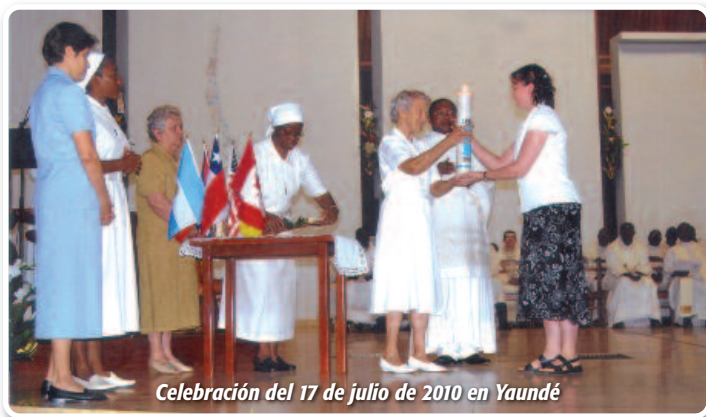
Celebración del 17 de julio de 2010 en Yaundé