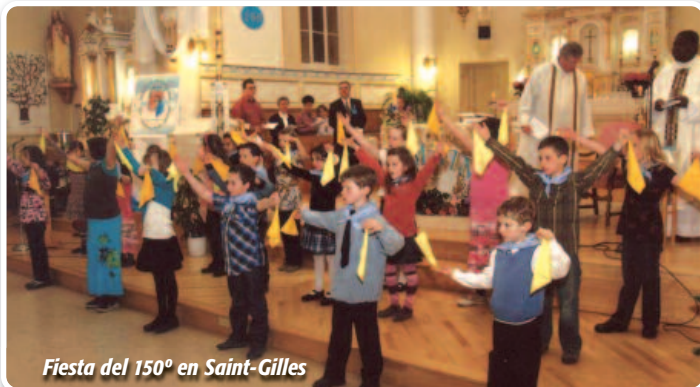
Fiesta del 150º en Saint-Gilles