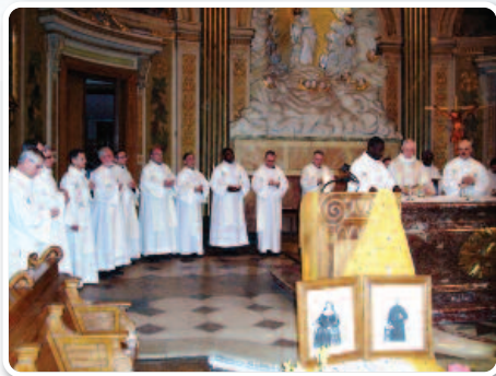
En la capilla de los Padres Espirituanos 30, calle Lhomond, París

¡150 años! ¡Tomar el tiempo de mirar el ayer para festejar hoy y dar un nuevo impulso al mañana! « Nuestra vida es una promesa de salvación que Dios realiza con nosotras año tras año. » ¡Qué bella es nuestra historia desde el día en que el camino de Juana María Moisan cruzó con el del Padre Francisco Delaplace! Para festejar este 19 de marzo de 2010, hemos escogido la capilla de la « casa paternal ». ¡Alegría de nuestros hermanos espirituanos que con acogen en « nuestra casa », según su decir! ¡Alegría compartida con numerosos amigos y afiliados! El 2 de mayo, con el consejo plenario, de nuevo la capilla de 30 de la calle Lhomond deja resonar nuestras alabanzas.