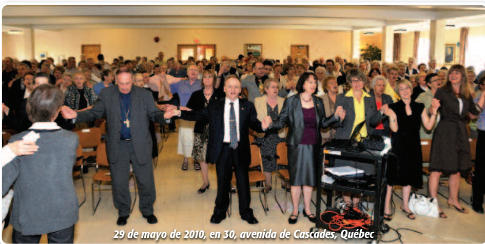
29 de mayo de 2010, en 30, avenida de Cascades, Québec

Víctor TONYE BAKOT , arzobispo metropolitano de Yaundé Distrito María Reina de los Apóstoles - Camerún