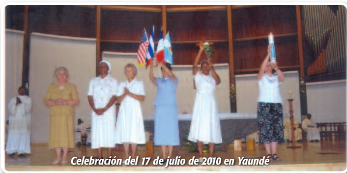
Celebración del 17 de julio de 2010 en Yaundé