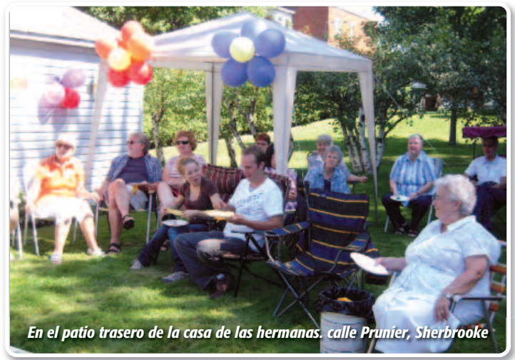
En el patio trasero de la casa de las hermanas, calle Prunier, Sherbrooke