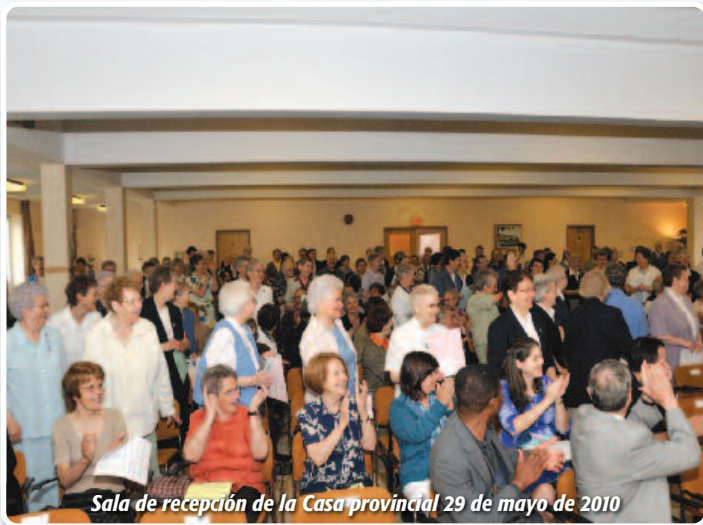
Sala de recepción de la Casa provincial 29 de mayo de 2010