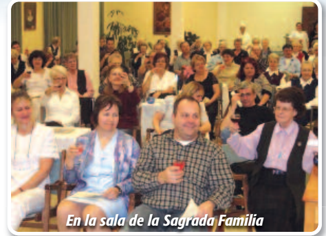
En la sala de la Sagrada Familia